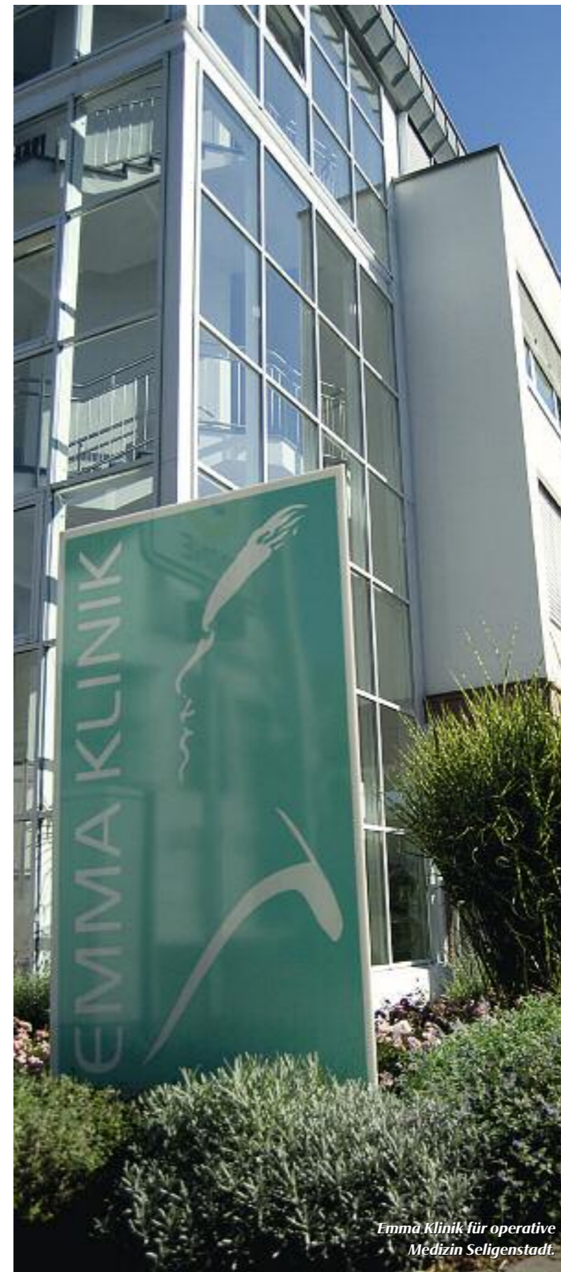
Emma Klinik für operative Medizin Seligenstadt.

sonderer Versorgungsformen oder Krankheiten eingehen. Der Erfolg für alle Beteiligten stellte sich für die LAOH-Ärzte schon wenig später ein. Bremer Wissenschaftler untersuchten 2006 die Ergebnisse der Behandlung und den Heilungsprozess von 1.700 hessischen Patienten und Versicherten der Taunus BKK, die von Chirurgen und Anästhesisten des LAOH operiert worden waren. Dabei wurde nachgewiesen, dass die nach dem Modell der integrierten Versorgung behandelten Patienten bis zu 35 Tage schneller wieder gesund und damit arbeitsfähig waren. Durch diese deutlich frühere Genesung konnten erhebliche Kosten vermieden werden, zum Beispiel beim Krankengeld. Auch die Patienten haben einen großen Nutzen, weil sie während der gesamten Behandlung nur mit dem Arzt sprechen, der sie auch operiert. So vermeiden sie unnötige Wege und Wartezeiten und erhalten eine Betreuung auf durchgängig hohem Niveau. Außerdem wird ein Teil des gesparten Geldes an sie weitergegeben, denn die Patienten sparen den Selbstkostenanteil für die Anschlussrehabilitation nach der Operation, und sie sind früher fit.