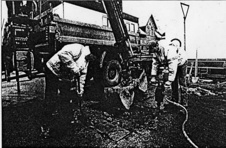
Stadtwerke-Einsatz, um gebrochene Rohrleitungen der Trinkwasserversorgung zu reparieren.