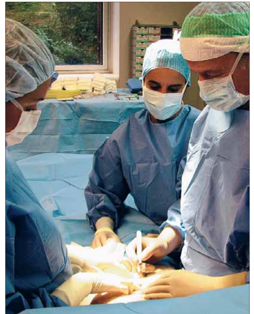
Viele Privatkliniken bieten medizinische Leistungen jenseits der Grundversorgung an, wie beispielsweise im Bereich der Schönheitschirurgie.

Mit einem Qualitätssiegel will der VOP dagegen bald einheitliche Standards setzen. Der Verband will ein Gütesiegel ausgeben, wenn eine Klinik sowohl bei der Qualität der ärztlichen Versorgung als auch der stationären Nachbehandlung definierte Mindeststandards einhält. Momentan ist der Markt weder transparent noch geregelt. Eine Privatklinik gilt als schlichter Gewerbebetrieb.